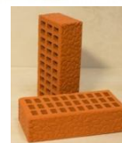
Красный «Панцирь черепахи»